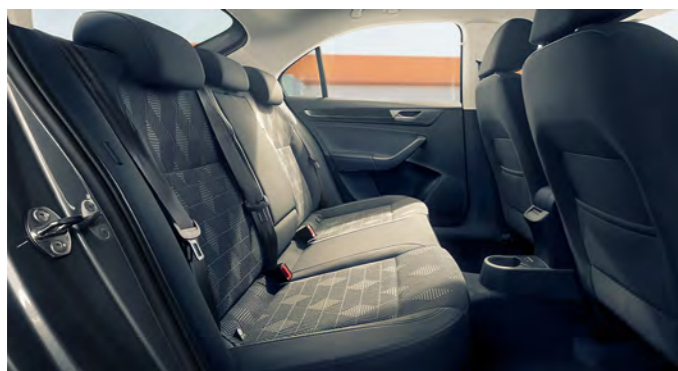
Подогрев задних сидений

Объём багажного отделения до 530 литров с возможностью трансформации салона и увеличения грузового пространства до 1460 литров.