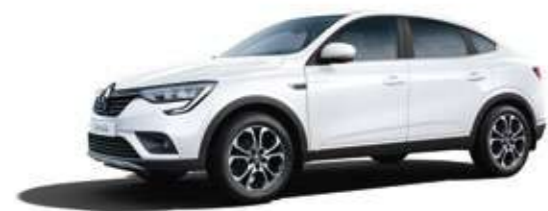
Белый BLANC GLACIER