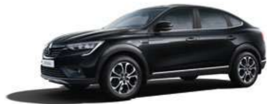
Черный NOIRE NACRE