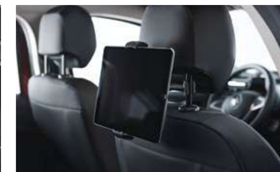
Крепление для планшета