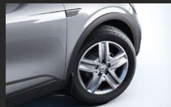
Стилизированные диски CELEBRIS 17"