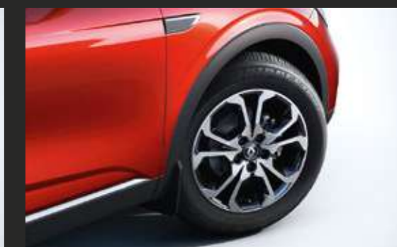
Легкосплавные диски MONTIS 17"