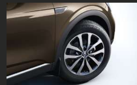
Легкосплавные диски ORTIS 17"