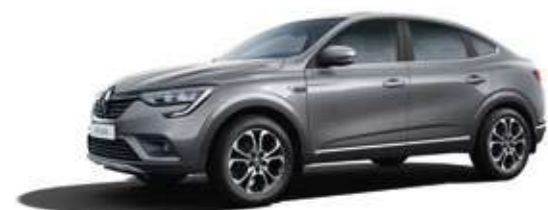
Темно-серый DARK GREY