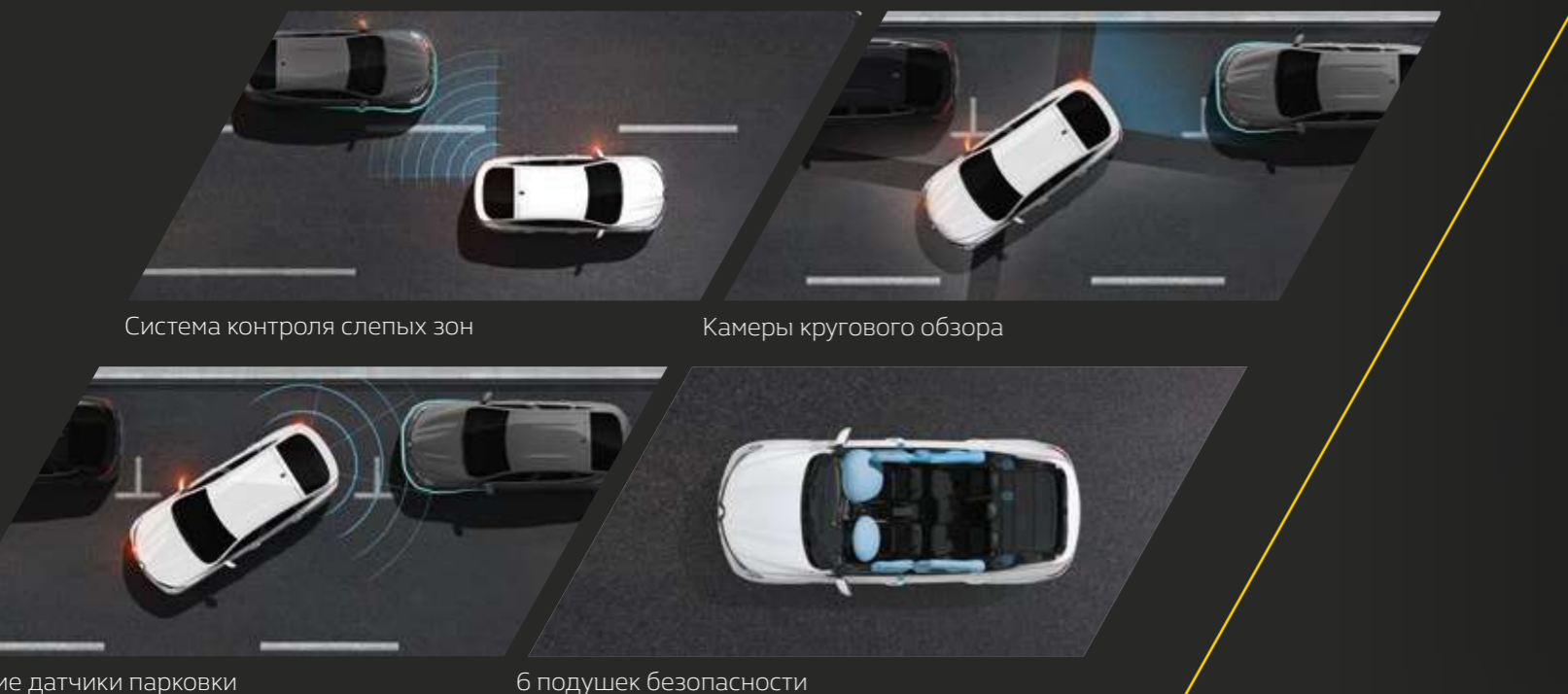
Система контроля слепых зон

Помимо традиционных систем активной безопасности (ABS, ESP, Hill Start Assist) новый Renault ARKANA предлагает системы помощи водителю, которыми легко управлять на экране EASY LINK. В зависимости от комплектации доступны: круиз-контроль с функцией ограничения скорости, система контроля давления в шинах, камеры кругового обзора, а также система контроля слепых зон, которая предупреждает о приближающемся автомобиле LED-сигналами в боковых зеркалах.