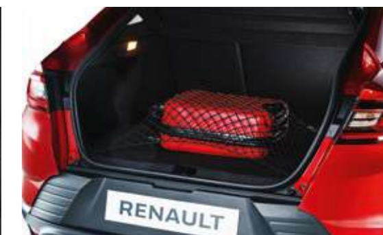
Сетки в багажник вертикальные и горизонтальные