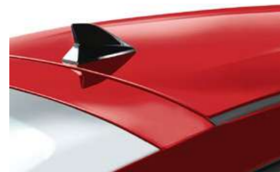
Антенна «акулий плавник»