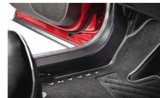
Ковры в салон текстильные