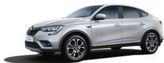
Серебристый GRIS PLATINE