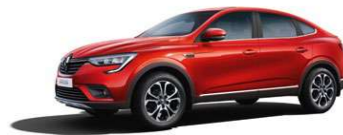
Красный RED FUSION