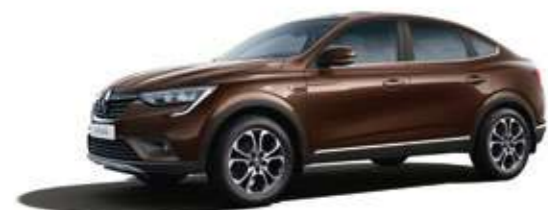
Коричневый MARRON GLACE