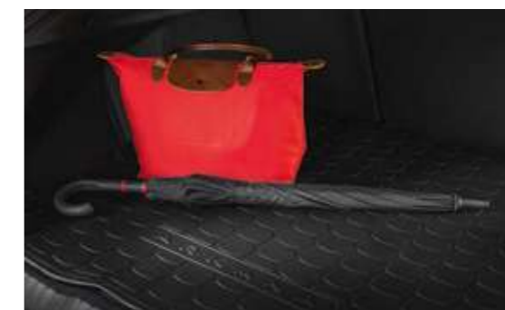
Поддон в багажник